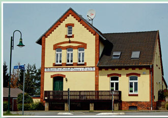
Gemeinde Demen ehem. Molkerei