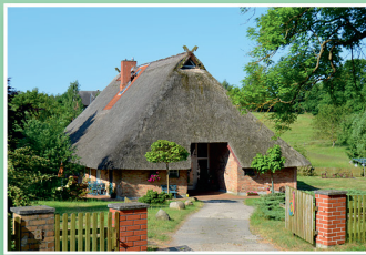
Gemeinde Pinnow Niederdeutsches Hallenhaus