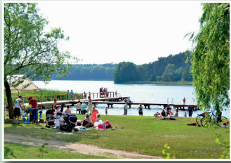
Gemeinde Barnin Badestelle Barniner See