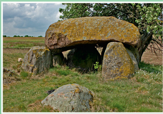
Gemeinde Friedrichsruhe Teufelsbackofen Neu Ruthenbeck