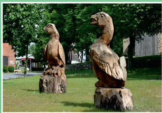
Gemeinde Tramm „Trammer Gois“