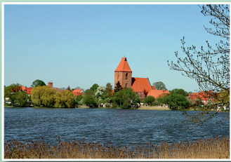
Stadt Crivitz Blick über den See