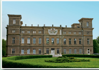
Gemeinde Bülow Schloss Bülow